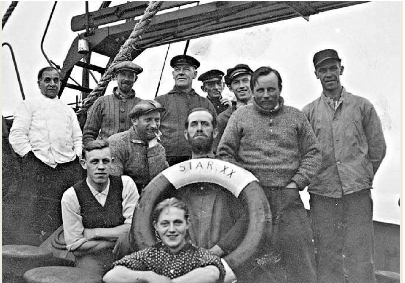
SFJ00319300655001 STAR XX. Mannskapsbilde