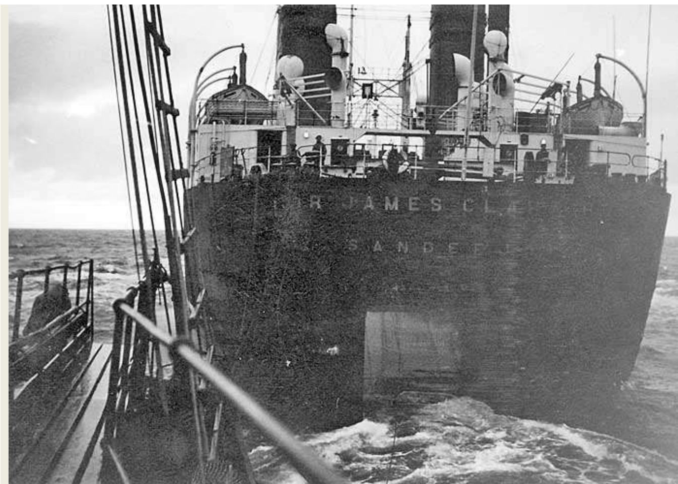
SFJ00319300620002 STAR XX inne for å levere hval.