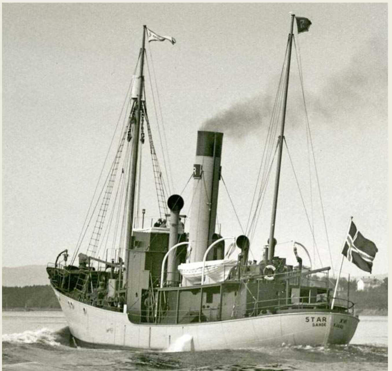
SFJ00319300720003 STAR XVI.