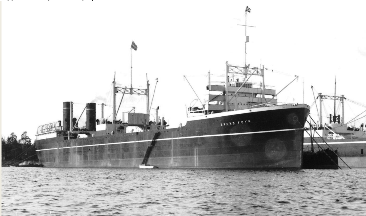
SFJ00319310220002 DS/Fik SVEND FOYN(2). Sommeropplag i Tønsberg.