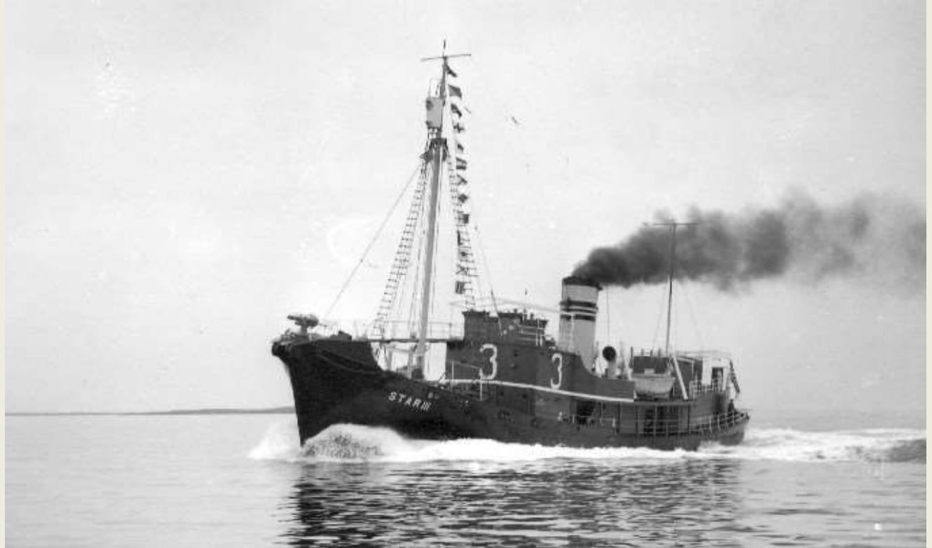
SFJ00319470220001 DS/Hvb STAR III går overleveringstur.