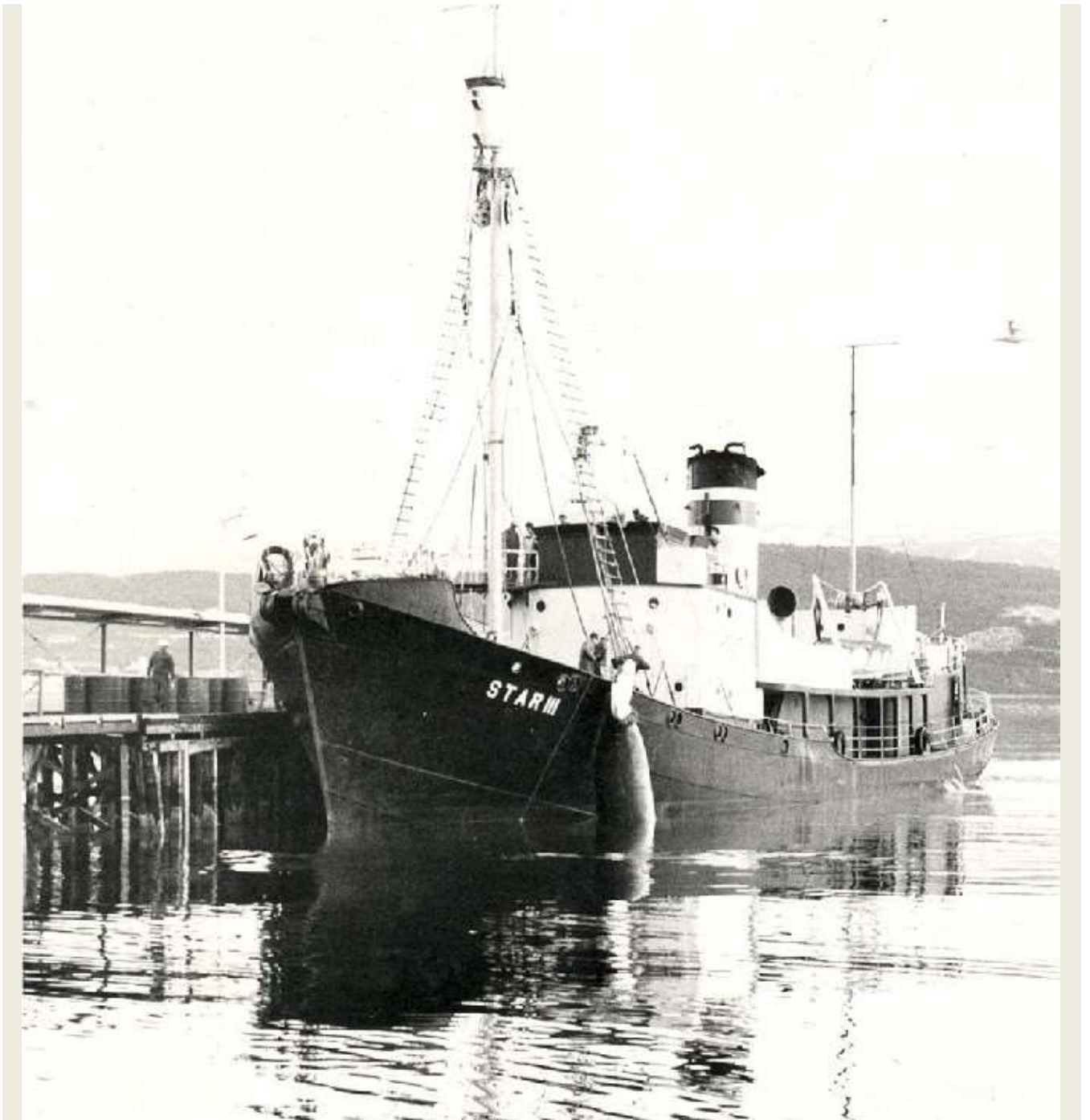
SFJ00319470220003 DS/Hvb STAR III som fangstbåt på Skjelnan.