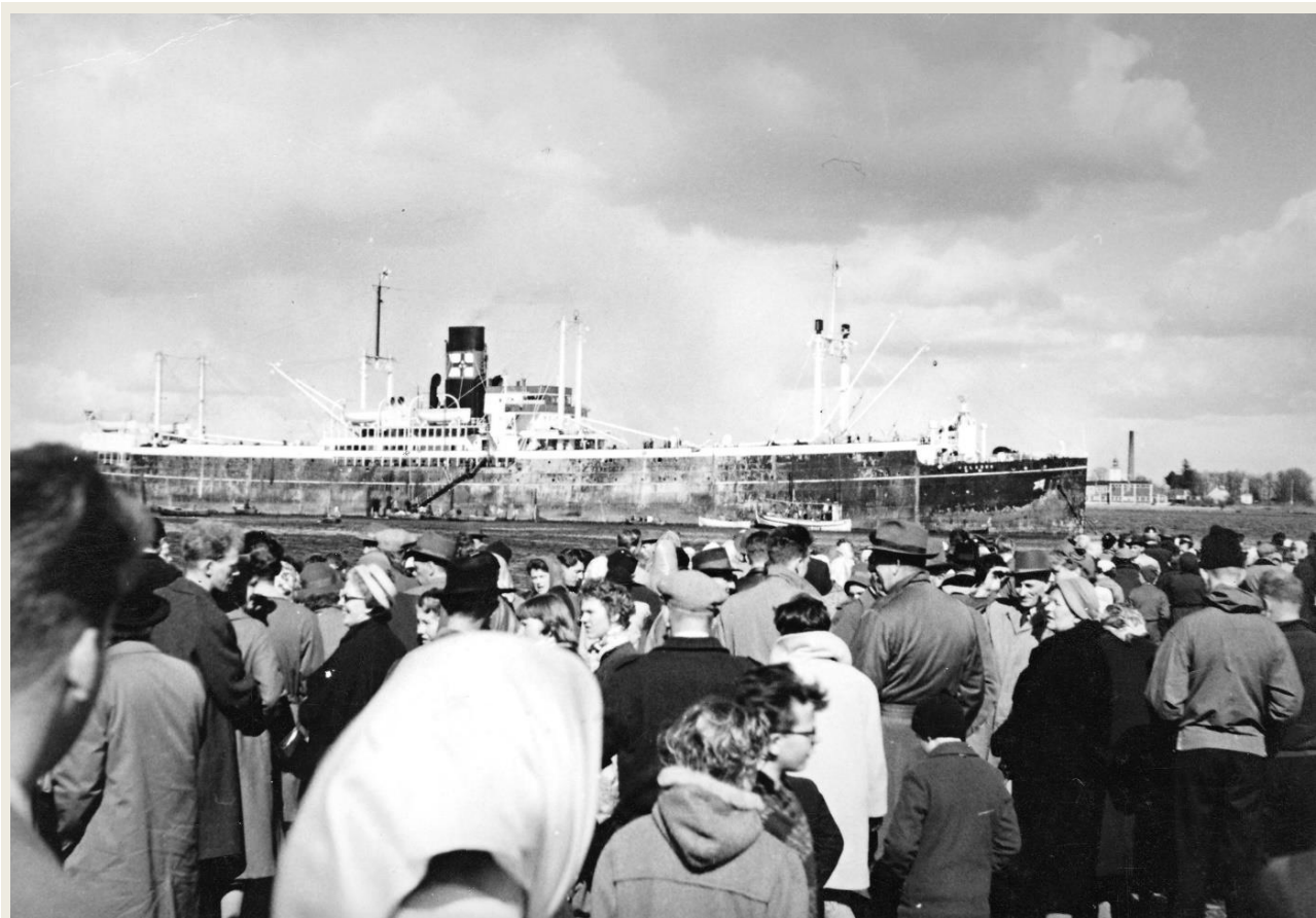
TBG10119460120003 PELAGOS ved ankomst Tønsberg.