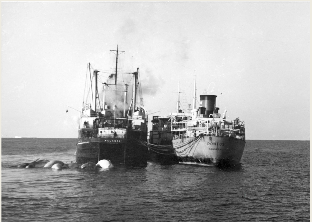
TBG10119460120003 PELAGOS (1) og PONTOS.