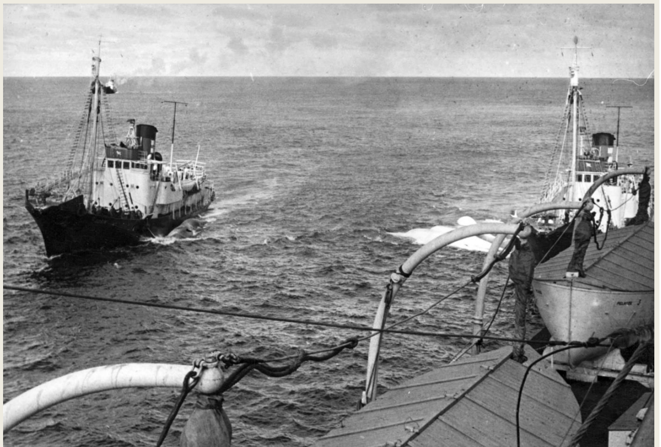
TBG10119460120003 PELAGOS (1).