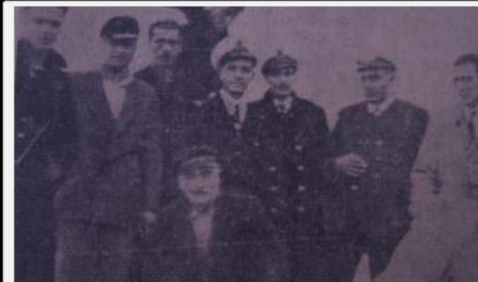
Φωτογραφίες από τη διάσωση από το φύλλο του Νεολόγου Πατρών της 17.1.1948

Bilder rednings fra Neologos Patras ark 01.17.1948